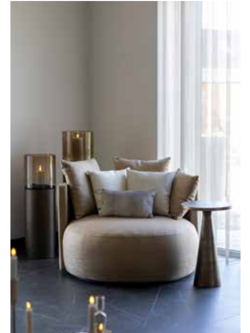
Rechts: ronde fauteuil Raffael Swing, sierkussens en bijzettafel Philos zijn bij Whoon Oisterwijk aangeschaft.

“Het afstylen lieten we aan de professionals over, dat voelde als ontzorgen”