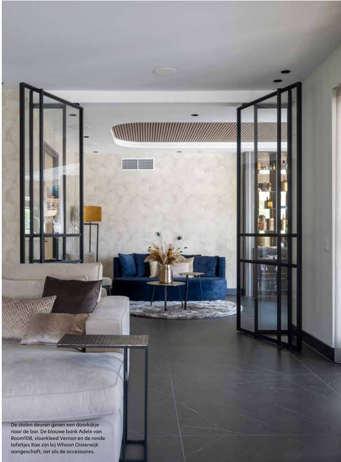
De stalen deuren geven een doorkijkje naar de bar. De blauwe bank Adele van Room108, vloerkleed Vernon en de ronde tafeltjes Kae zijn bij Whoon Oisterwijk aangeschaft, net als de accessoires.